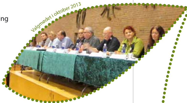
Valgmodet i oktober 2013