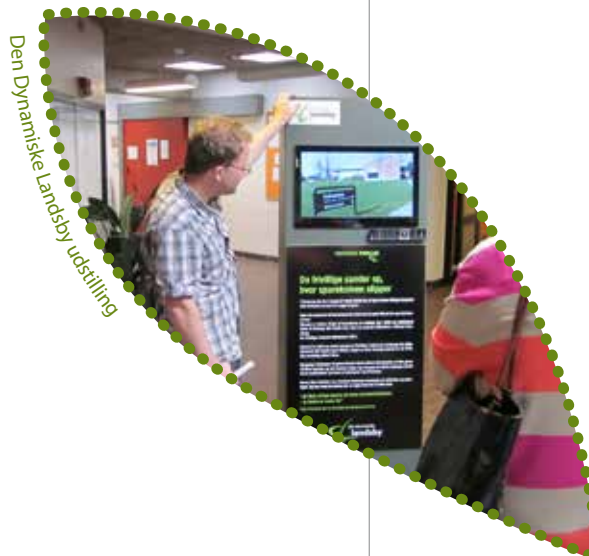
Den Dynamiske Landsby udstilling

Vorbasse Lokalråd, Vorbasse Grundejerforening, Vorbasse Fonden, Vorbasse Erhvervsforening og DDL.